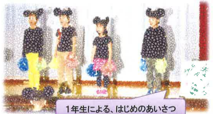
1年生による、はじめのあいさつ

今年度2回目となる10月30日の全校参観日では、多くの保護者にご来場いただき、子どもたちが劇や器楽合奏、ダンスなど学習発表会の内容を披露しました。1か月ほど練習に取り組んできた成果を発揮することができ、この取組を通し、目的に向かって力を合わせて一体となる喜びや満足感を得たことと思います。ご参観頂き、大変ありがとうございました!