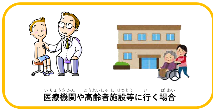
いりやうきかん こうれいしやしせつとう い ぼあい 医療機関や高齢者施設等に行く場合