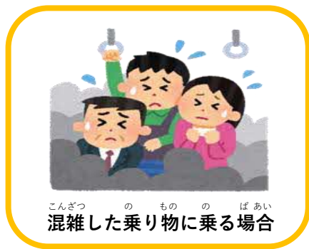
こんざつ の もの の ぼあい 混雑した乗り物に乗る場合

ただし、つぎ げい あい ちやくよう すいしやう ただし、次のような場合は、マスクの着用が推奨されます。