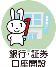
銀行・証券 口座開設