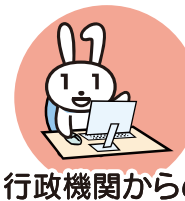
行政機関からの お知らせ・各種証明書