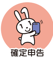
確定申告 (2024年度より)