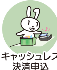
キャッシュレス 決済申込