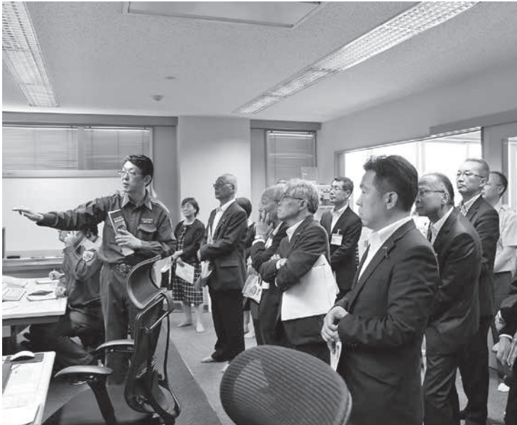
119番通報指令センター（とちか広域消防局）

現地調査後の委員会では、第2回定例会提出予定の、町税条例の一部改正、十勝圏複合事務組合規約の変更、温水プールの配管等更新工事にかかる工事請負契約の締結及び一般会計補正予算の概要などの説明を受けた。