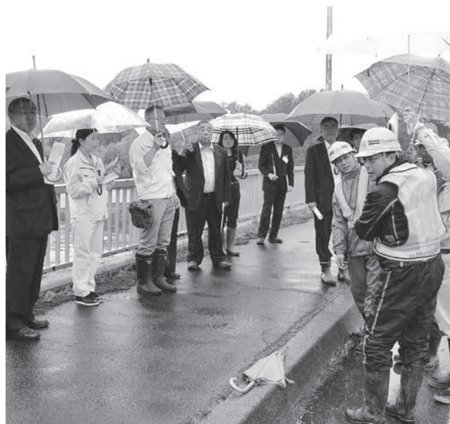
災害復旧現場を調査（音和橋）

その後、JAおとふけの農産センターを訪問し、小麦施設、大豆施設、小豆の施設のそれぞれ概要説明を受けた。さらに、今定例会の補正予算に計上されている