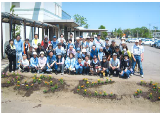
↑ 花壇設置後の様子