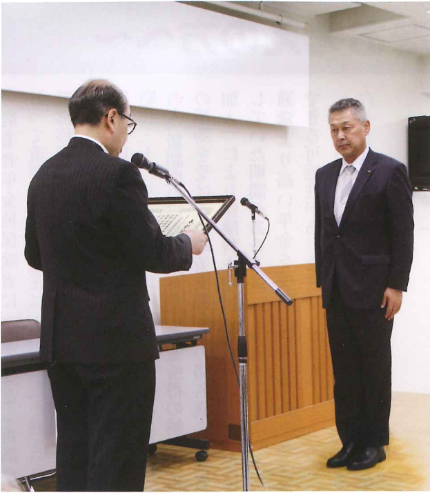
表彰を受ける石川協議会会長

今年度音更町は、平成二十九年度の年金加入者推進活動において、全体の加入者数、二十〜三十九歳までの加入者数、女性の加入者数、以上全三部門において全国二位を記録し、総会において表彰を受けました。