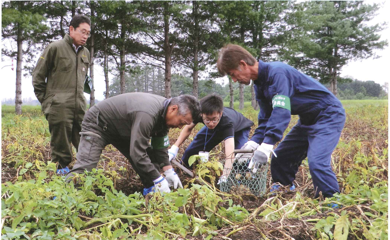
8月29日、音更町農業委員会では、町内を巡回し、作況調査及び農地パトロールを行いました