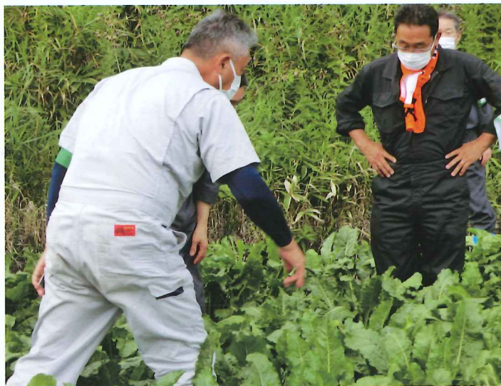
委員による圃場の説明

八月三十一日に町内十一カ所で作況調査及び農地パトロールを実施しました。作況調査は、農業委員の圃場で馬鈴薯・豆類・ビート・ブロッコリー・人参の七品目を目視及び実際に作物を手にとることで行いました。