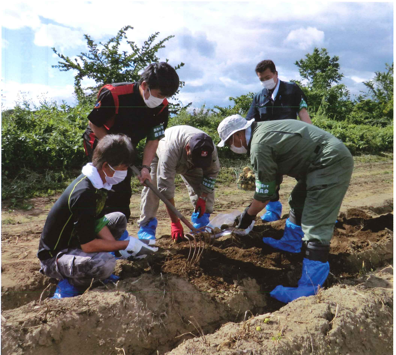
作況調査では馬鈴薯の生育状況を手に取り確認しました