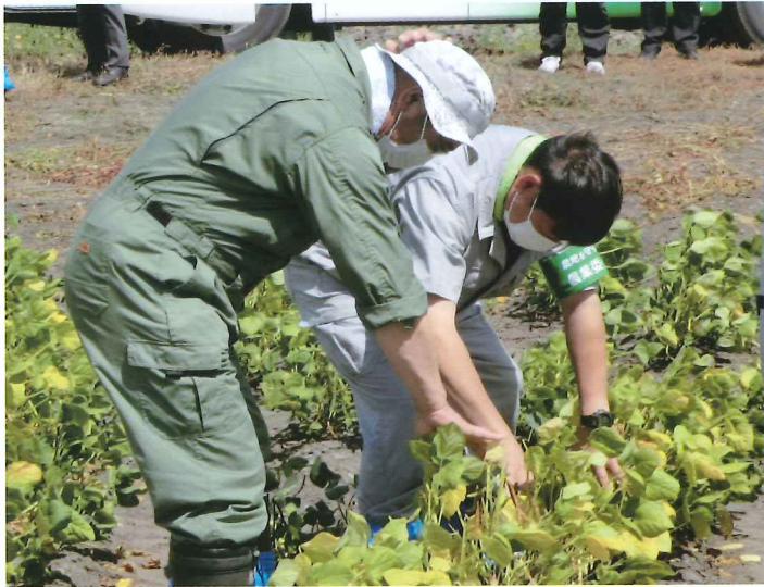
小豆の発育を調査しているところ