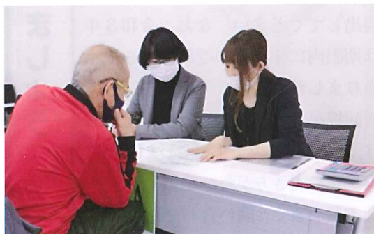
全体説明のあと、希望者に個別相談を行いました