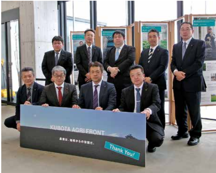
AIやロボットを活用した栽培など最先端の農業技術を学びました

令和6年2月1日から2日の日程で農政部会視察研修を実施し、農政部会委員等9名が参加しました。