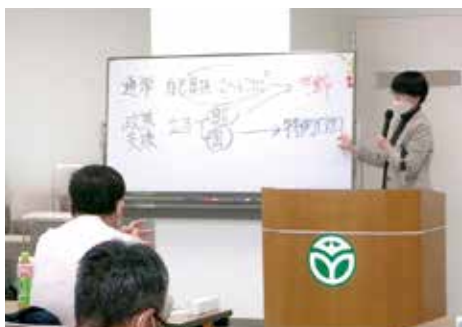
全体説明をする北海道農業会議の幡野講師

来年度も年金受給に向けた説明会を開催する予定です。該当する人には文書でご案内しますので是非ご参加ください。