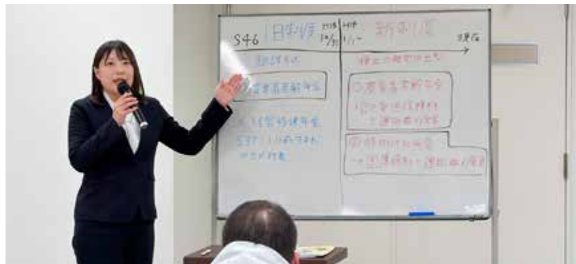
年金説明会の様子

来年度も、年金受給に関する説明会を開催する予定です。令和9年2月1日時点で59歳から64歳までの人には文書でご案内しますので、ぜひご参加ください。