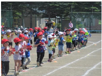
1・2年 全力でおどろぞ!チグハグ