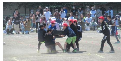
6年 パワフルタイヤ奪い