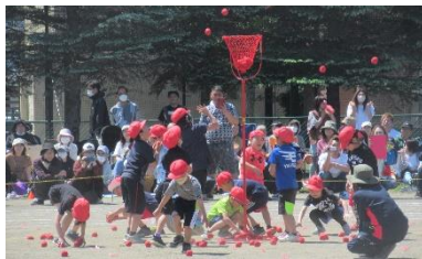
2年 ねらいをさだめていれろ!玉入れ