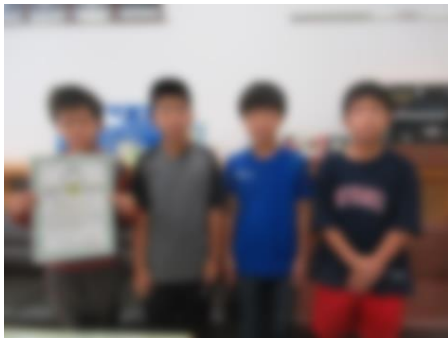
2023フクハラ杯 サマーフェスタ Cブロック第1位 緑陽台 SSjrFC