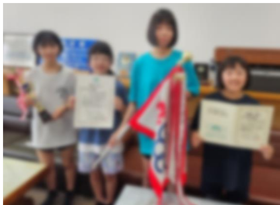
第43回全十勝スポーツ少年団 バレーボール交歓大会 女子の部 優勝 女子の部 優勝 R・Yスパークス