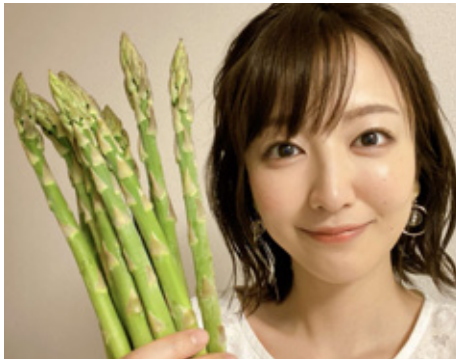
地元音更産のアスパラ

『やっぱり音更の野菜は別格！次の新作のお菓子は何だろう…』とやはり音更と母が恋しい。ホームシックになつたお陰で、改めて音更の魅力に気がついた。