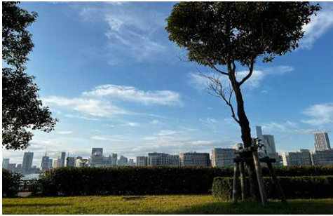
公園から見えるビル群

最近音更に帰ったのは2年前。ずいぶん時間が経ってしまいました。こんなにも長く帰れていないのは上京してから初めて。そろそろ故郷の空気を吸いたい…。 とある休日の昼下がり、サイクリング中に見つけた公園で芝生にシートを広げ、テイクアウトのハンバーガーを食べました。心地よい風を感じながら、フカフカの芝生に腰をおろし、ただぼーっと過ごすことがこんなにも幸せだなんて！東京での生活は、時間の流れるスピードが自分のペースより少し早く、その時差をこんな風に休みの日に調整しています。 「東京でものんびり過ごせる場所があるもんだな」と思いながらふと目線を上げると、川の向こうには高さを競うように立ち並ぶビル群がひしめき合い、「また月曜日からよろしくね」と言われている気が…。 ああ、どこまでも緑が広がる十勝平野が恋しい！