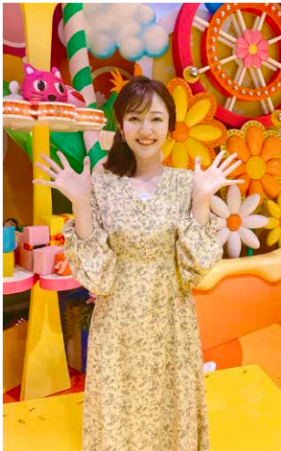
新年度もよろしくお祈りします

新学期、新社会人、新生活…。4月は物事のス タートが多い月。この応援大使コラムも令和2年 4月に始まり丸2年が経ちました。 節目なので、これまで書いたコラムを読み返し てみると、「悪くない」と思えるものから、「も っと表現を磨かねば…」と反省するものも。 そしてもう一つ反省が。いつもコラムを提出す るときは広報係の担当の方とメールでやりとりを しているのですが、今まで送ったコラムを読もう とメールの送信履歴を見返すと、回を追うごとに 頻発していく「締め切りギリギリで申し訳ありま せん」の一文。そして、このコラムを書いている 今、もう既に締め切りギリギリ。初めの頃は余裕 をもって提出していたはずなのに、つい甘えが出 てしまっていたようです。 新たなスタートを切る人もそうでない人にも、 何より自身に『初心忘るべからず』の言葉を 送りたいと思います。