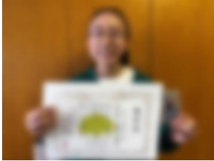
剣道 ○○○○さん 6年 豊頃はるにれ杯 3位