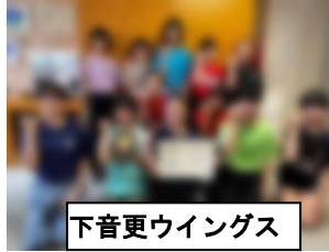
全日本バレーボール小学生大会 帯広地区予選 準優勝