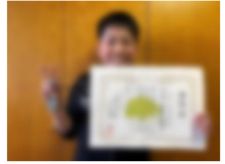
剣道 ○○○○さん 6年 豊頃はるにれ杯 優勝