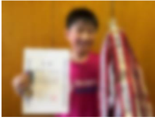
バド ○○○○さん 4年 ABCバド十勝予選B 優勝