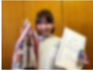
バド ○○○○さん 2年 ABCバド十勝予選C 優勝