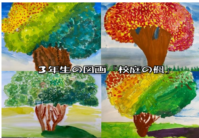
3年生の図画「校庭の楓」