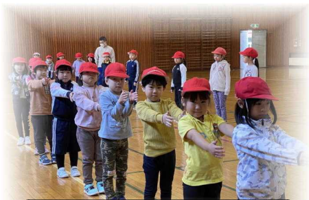
体育で並び練習したよ！

本年度も教育に携わる者として学校・家庭・地域が共通の認識に立ち、子どもの指導・助言・支援に当たることができるよう、皆様のご理解とご協力をお願いいたします。