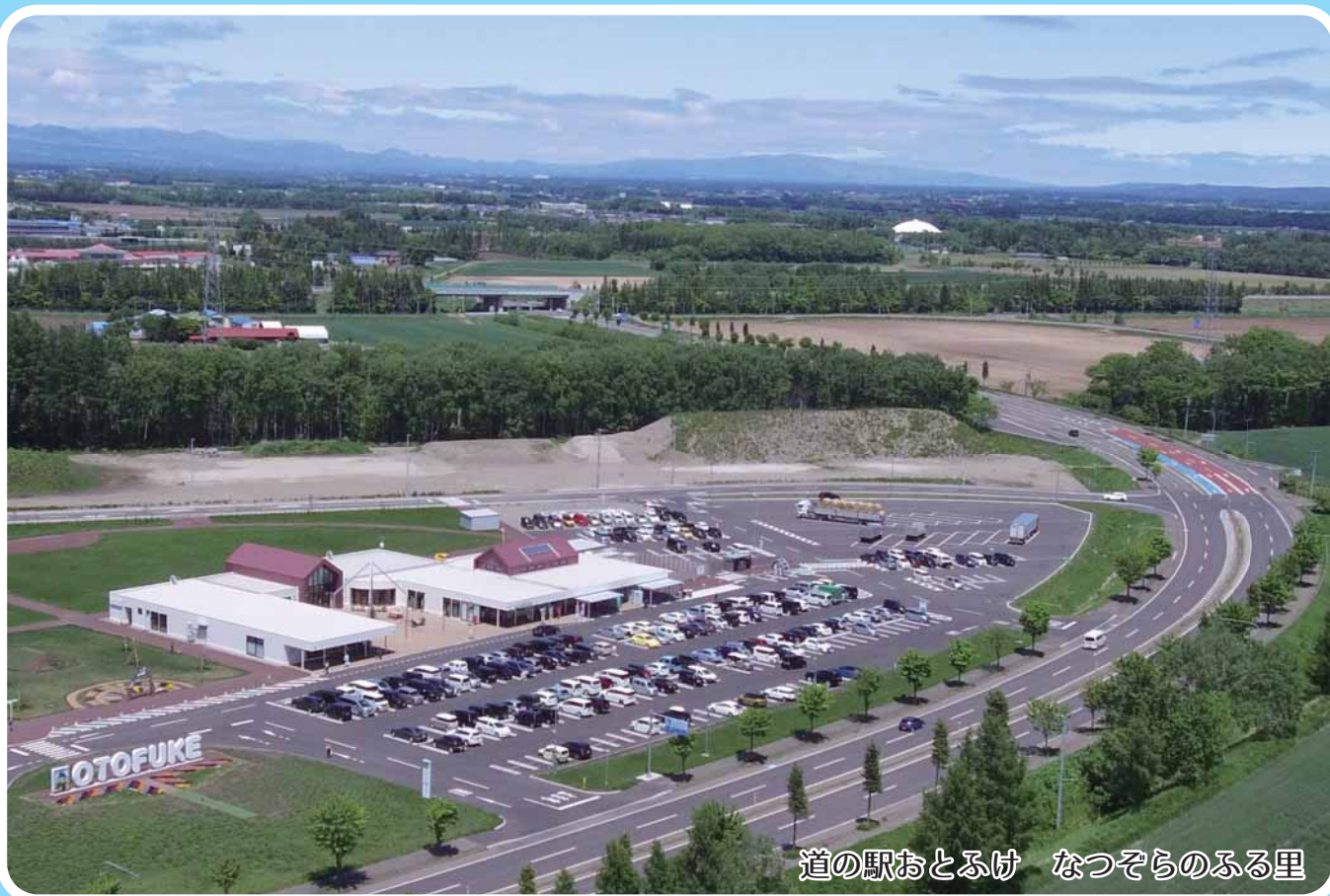
道の駅おとふけ なつぞらのふる里