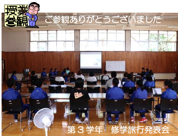
第3学年 修学旅行発表会