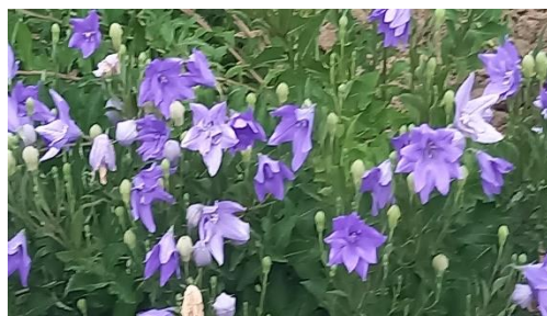
＜ ききょうの里 ～桔梗花壇～ ＞