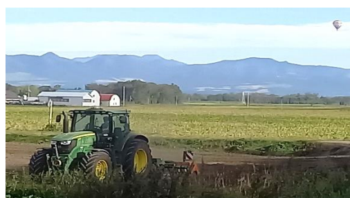
【トラクターと気球 / 東音更】