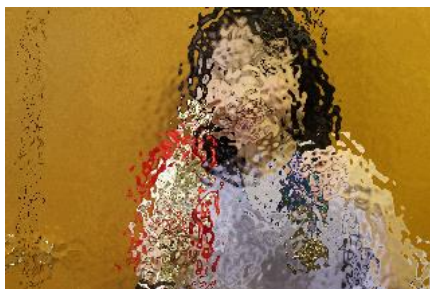
緑陽台サッカー少年団 カラマツ杯U8優勝・MVP 〇〇 〇〇さん(3年)