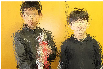
オンオール・サッカー少年団 第8回フレンドリーカップU9優勝 〇〇 〇〇さん(3年) 〇〇 〇〇さん(2年)