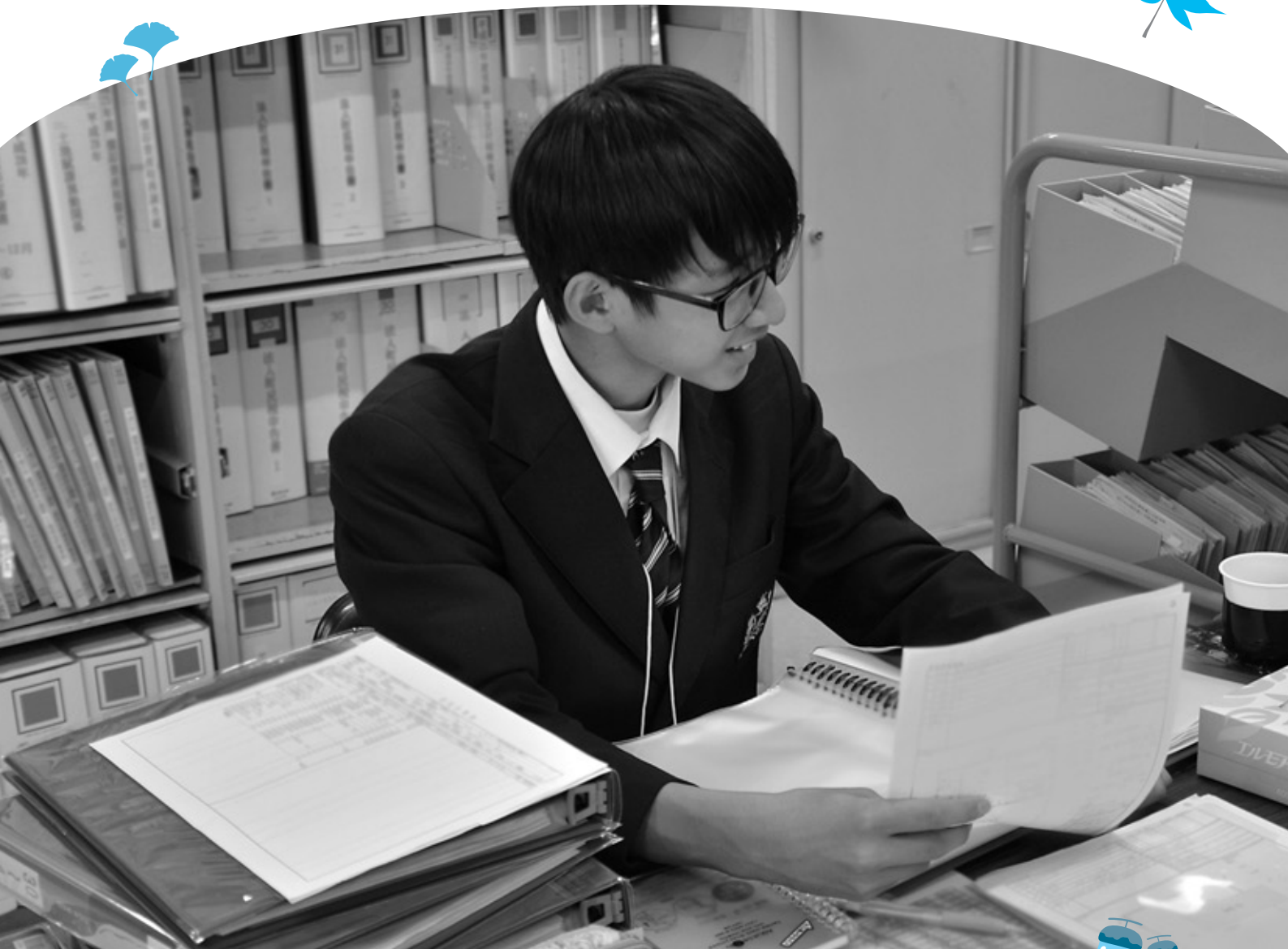
インターンシップで役場の業務を体験する音更高校2年生