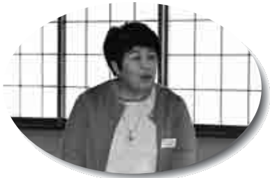
開会のあいさつをする河田会長

はじめに同協議会の河田会長が「日頃の介護の大変さなどをこの場で話してもらって、少し自分の心がほっとするような介護から解放されるような時間を過ごしてほしいです」とあいさつ。自己紹介などの後、劇団飛翔の舞踊を観劇しました。昼食を挟み、芝居と舞踊の観劇後、入浴したり参加者同士交流したりして介護の疲れを癒やしました。参加者の1人は「普段自分だけでは遠いところに行けないので、こういう機会があるのは良いです」と話してくれました。