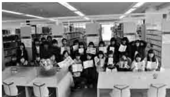
▲図書館司書の資格を取る学習中の1コマ

帯広大谷短期大学では学科によって専門的な資格を取ることができませんが、地域教養学科では3つの資格を取ることができます。 博物館などで働く学芸員 図書館などで働く図書館司書、そして地域社会の基礎を作る社会教育主事、この3つの資格を同時に選択して2年間で取得できるのが魅力です。しかし資格を取るだけがこの学科の魅力ではありません。