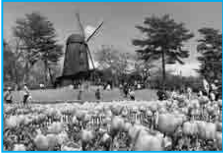
多くの行楽客が訪れた軽米のチューリップ園