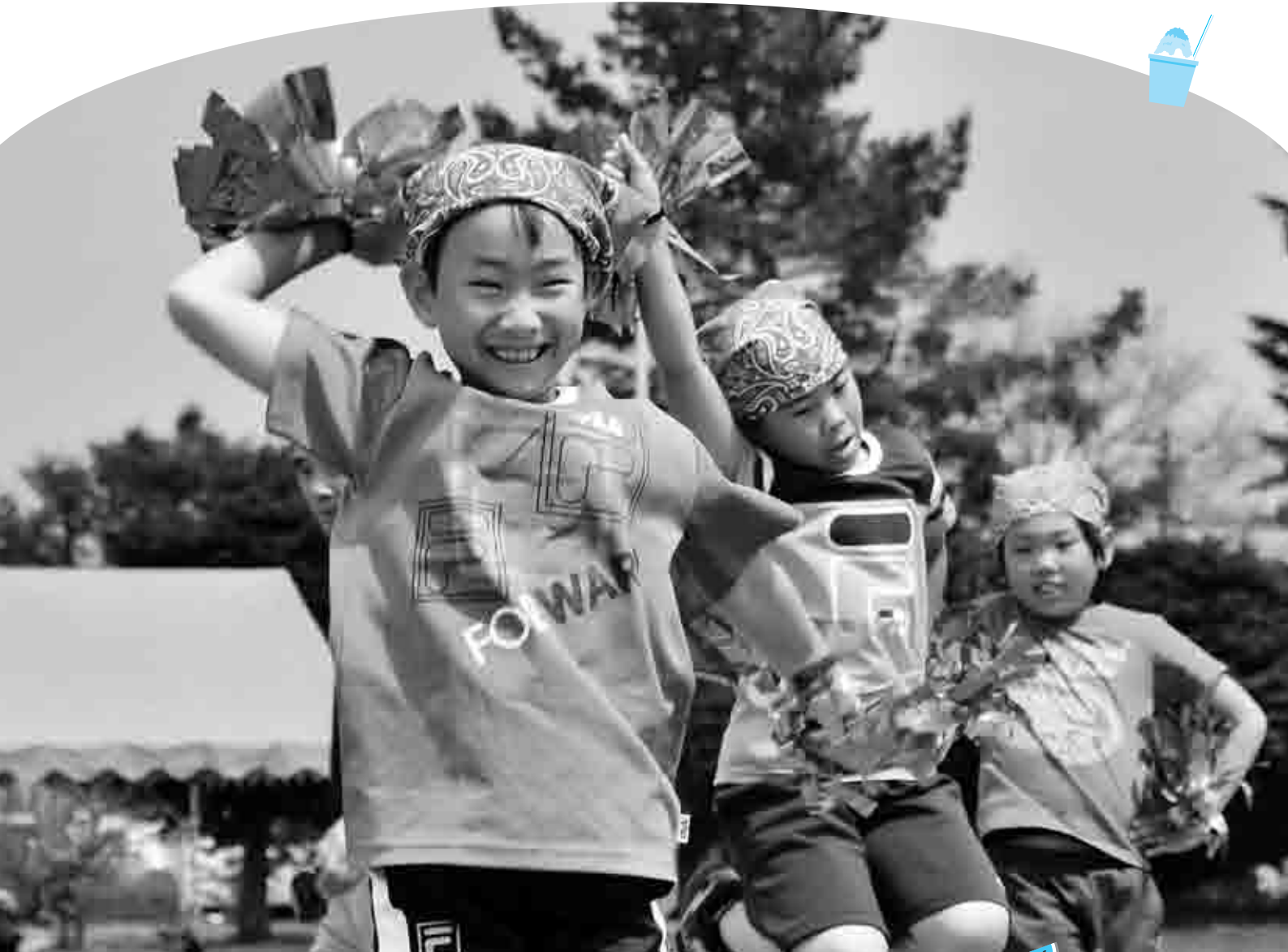
緑陽台小学校運動会で元気に踊る児童