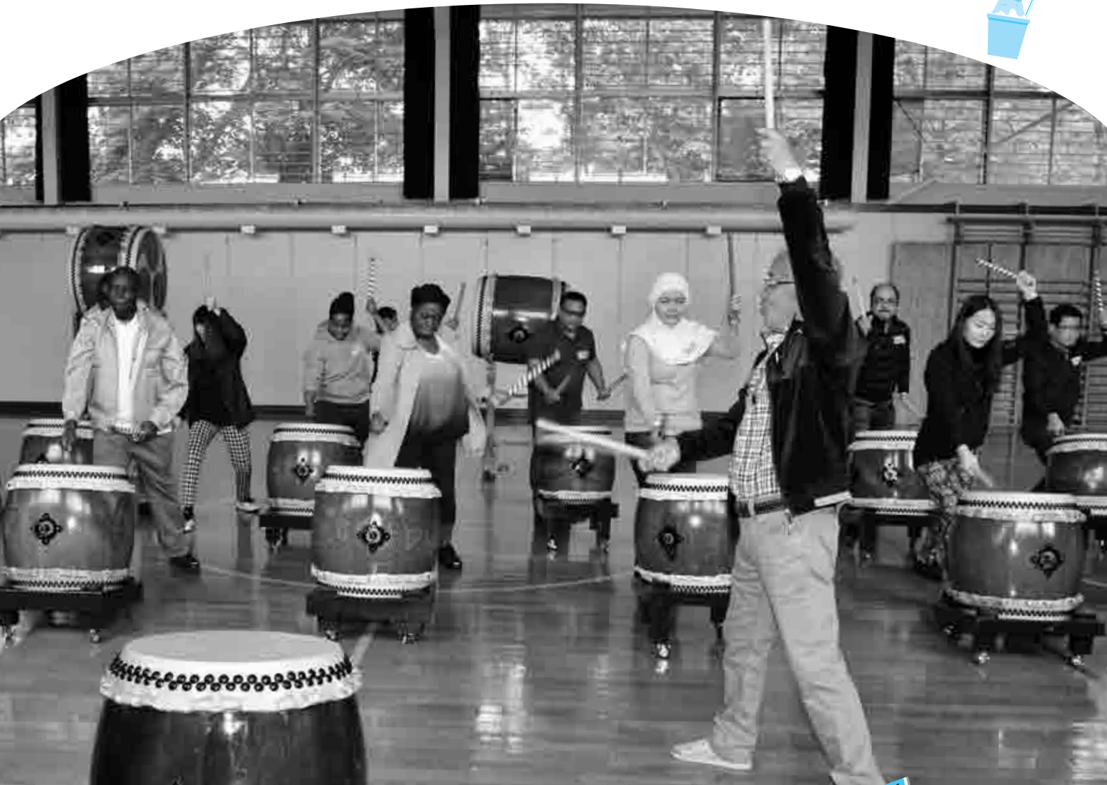
郷土芸能音更駒太鼓保存会から指導を受けるJICAの研修員