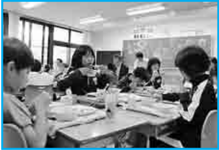
給食を楽しむ3年生たち