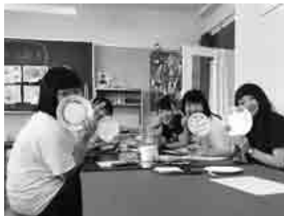
▲子どもアート万博で使う作品作りの様子