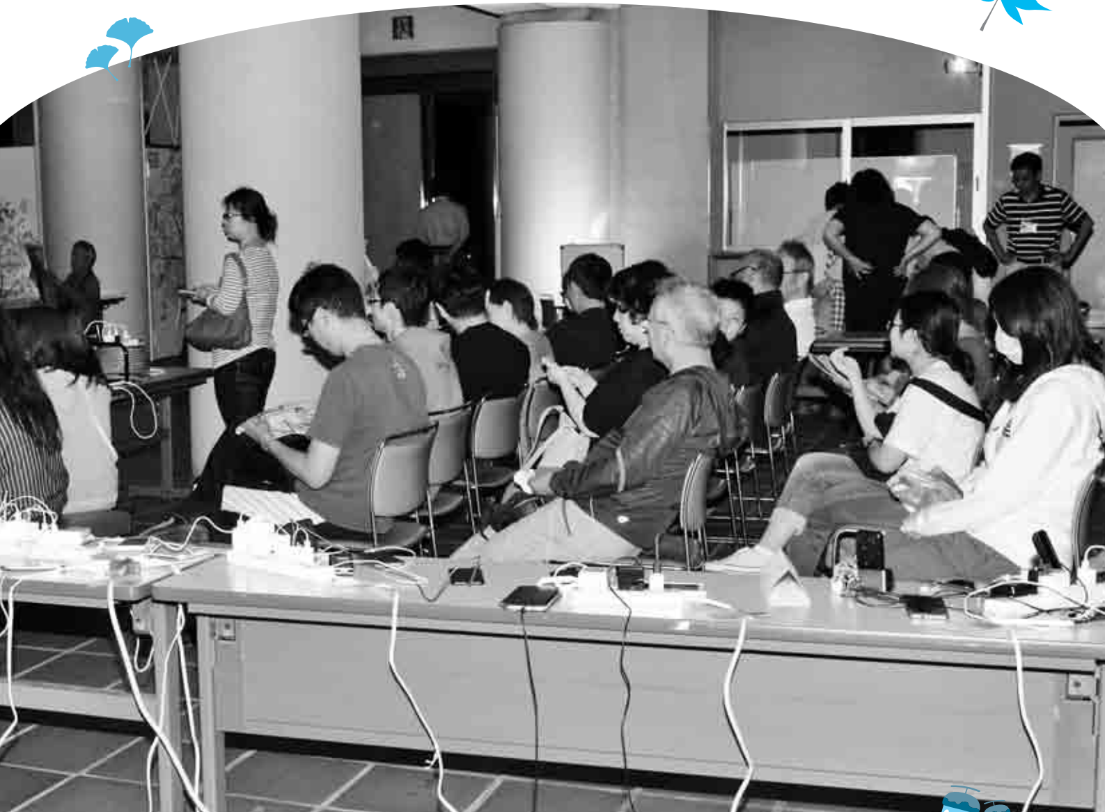
停電の影響で携帯電話の充電のため共栄コミセンを訪れた人たち