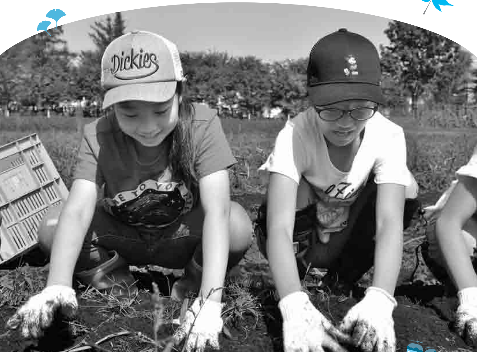
じゃがいもを掘り起こす子どもたち