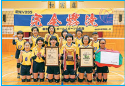
3連覇を達成した軽米VBSSの皆さん