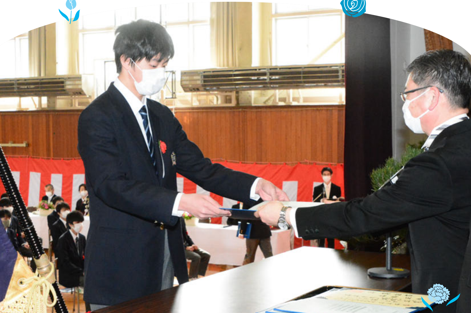
卒業証書を受け取る卒業生（音更高校卒業式）