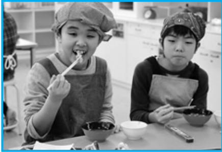
食べたらずまず笑顔