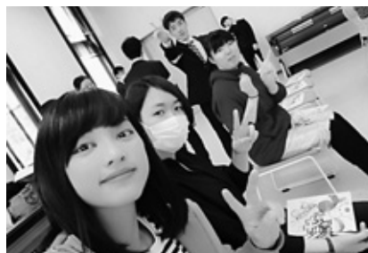
▲新入生へのサークル紹介直前の私と友人たち

ホッケーの合宿で大きな怪我をし、水上に戻れるまで8カ月かかりました。戻ってこられたのは支えてくれる人たちがいたからです。