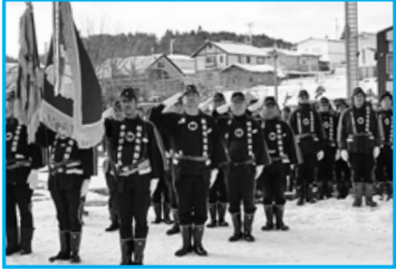
今年1年の防災を誓った消防団