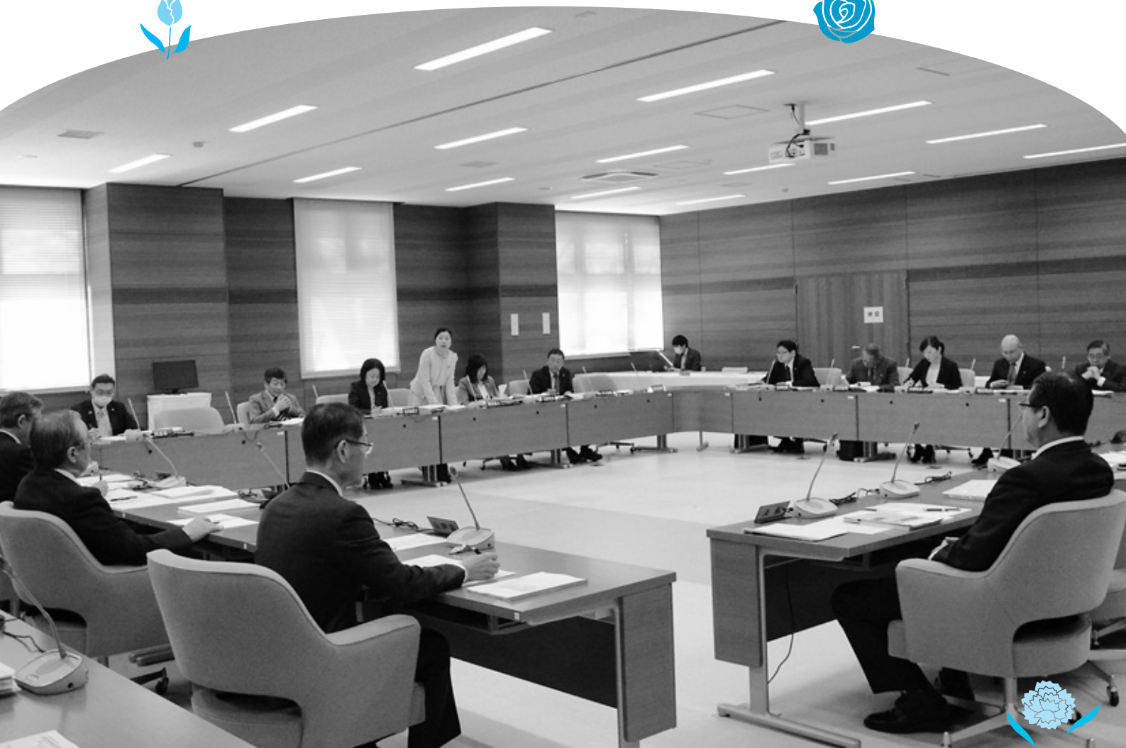
新庁舎で初めて開かれた予算審査特別委員会初日の様子