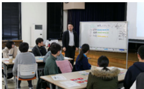
▲ゲーム後、世界の経済と環境と社会状況のバランスを振り返る

うことを教えてくれるものだったのです。 環境破壊については、これを読んでいる皆さんも関係ない話ではないと思います。今から地球に優しい生活をしてみませんか。例えば買い物時にはエコバッグを使う。そんな小さなことから環境は少しずつ救われていくと感じたワークショップでした。