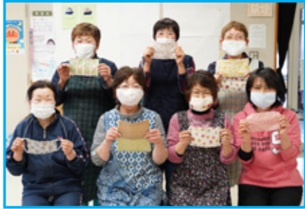
ボランティアの皆さん