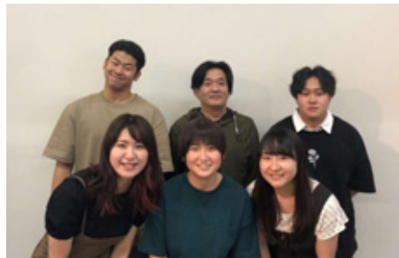
▲お元気コール担当学生