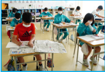
新聞を教材にノートをとめる児童たち