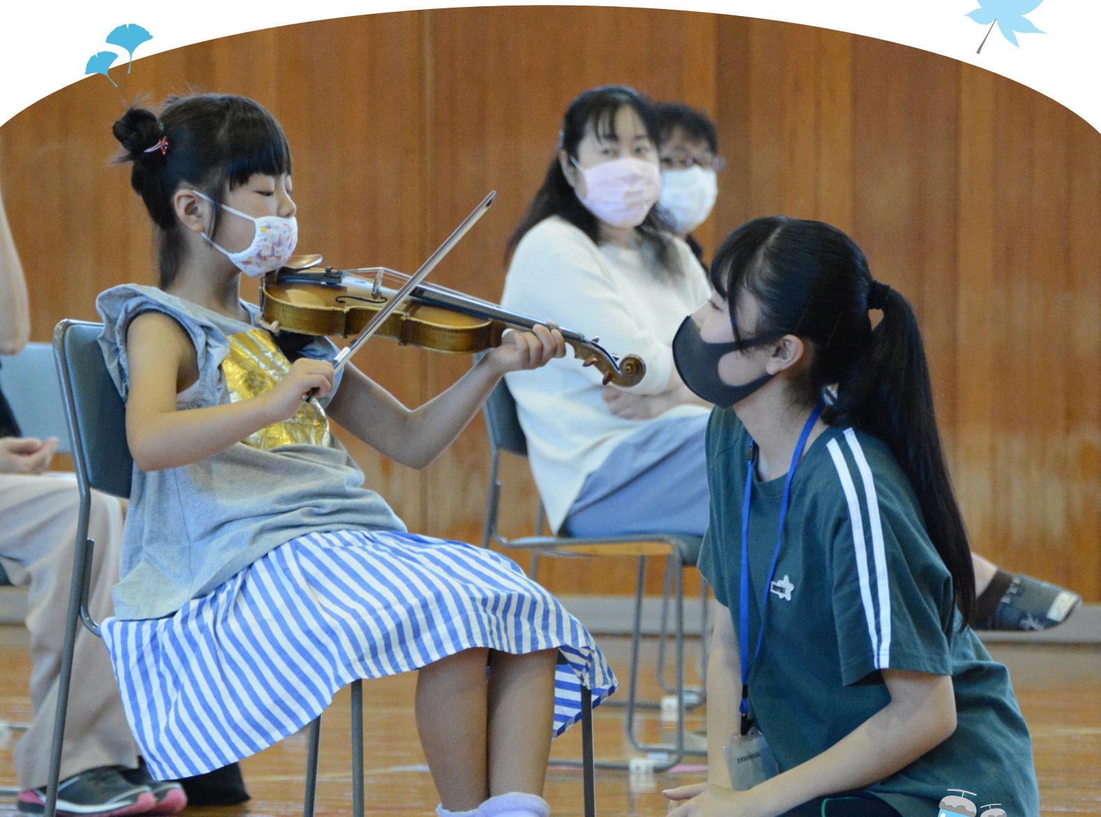
弦楽器体験講座で音更高校管弦楽局の生徒にバイオリンを教わる参加者