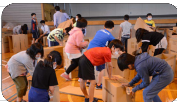
9/18 鈴蘭小学校防災学校で 4年生は避難所設営を 体験しました