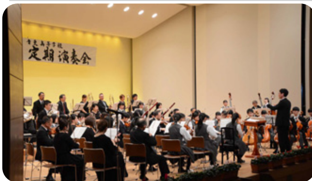
9/21 音更高校管弦楽局が 第29回定期演奏会を開催