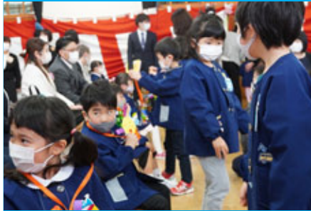
在園児からのプレゼントを喜ぶ 新入園児たち