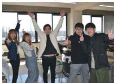
▲地域教養学科で楽しく学んでいます

能です。さらに、ビジネスコミュニケーションについての講義など、将来に役立つ内容の講義も設けられています。 これらの学びに加え、図書館司書・学芸員・社会教育主事の資格取得が可能となっています。 最後に、この紹介で地域教養学科について興味を持っていただけたら幸いです。