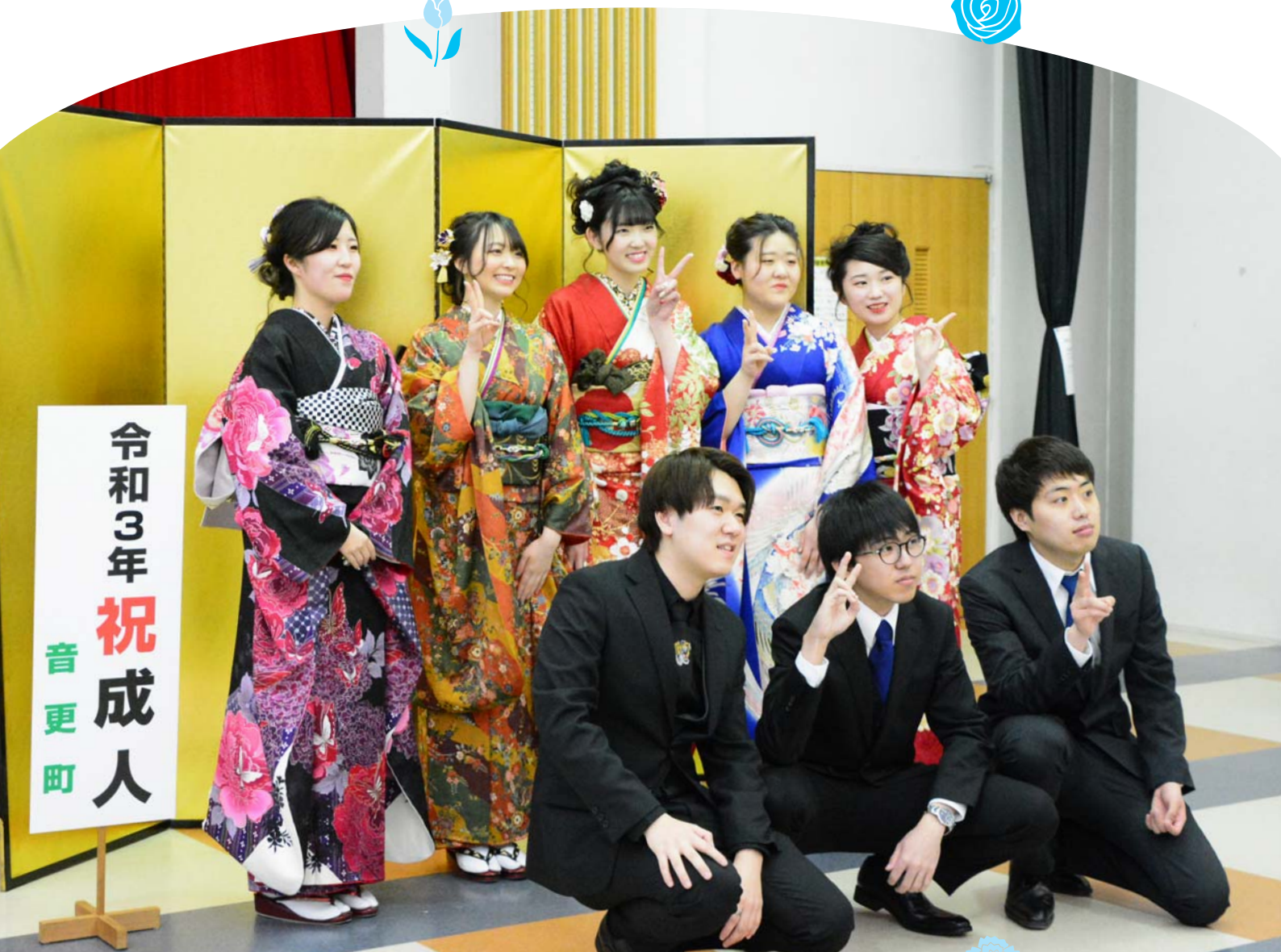
成人式再延期のため設置された記念写真撮影スポットで晴れ姿を撮影する新成人