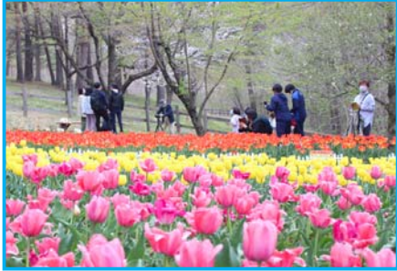
場内を彩るチューリップの数々

森と水とチューリップフェスティバルが4月29日から5月16日にかけて、雪谷川ダムフォリストパーク・軽米で開催されました。32回目の開催となる今回はチューリップの球根を一新。色とりどりのチューリップが場内を華やかに彩りました。軽米町観光協会主催のインスタグラムフォトコンテストも開催され、来場者から多数の応募がありました。