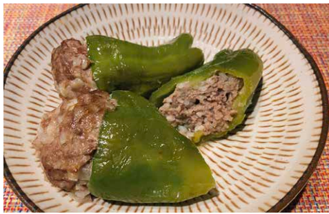
南スーダンのマハシ

「えー、南ス ーダンではピー マンの肉詰め お米も入れるん だ」など発見も あり、意外な組 み合わせから生 まれる新しい味 わいで、最近 再びフクフクし ながら食を楽し んでいる。