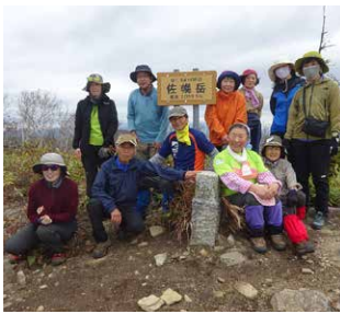
▲山頂にて記念撮影

受講者の様子に注意を払いながら、コースガイドや遠くに見える日高山脈の山名を丁寧に説明してくれました。参加者からは、「秋山を満喫しました」との声が聞かれました。