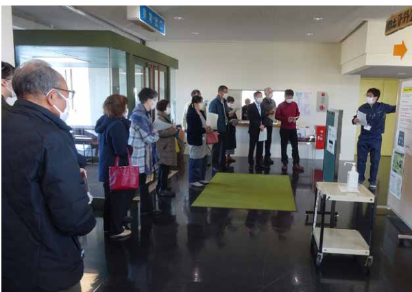
▲郷土資料室リニューアルセミナーの様子