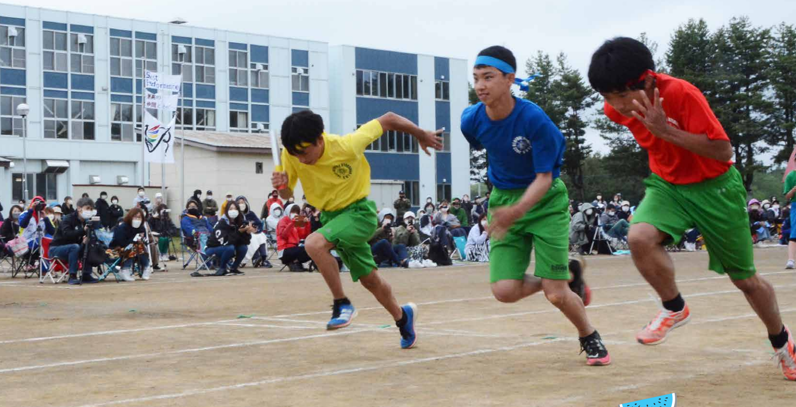
チームのために懸命に走る緑南中学校体育祭学年リレーの様子