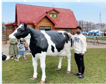
休日に道の駅おとふけ「なつぞらのふる里」に行ってきました！

にもこの町の魅力を見つけていきたいです。 人の温かさが溢れ、温泉や食べ物といった魅力のある音更町をスポーツを通じて盛り上げ、サッカーでは目標である「JFL昇格」を達成し全国にこの町の魅力を発信していけたらと思います。 最後になりますが、地域おこし協力隊での活動やスカイアースでの試合情報をSNSで発信しています。二次元バーコードからぜひご覧ください！