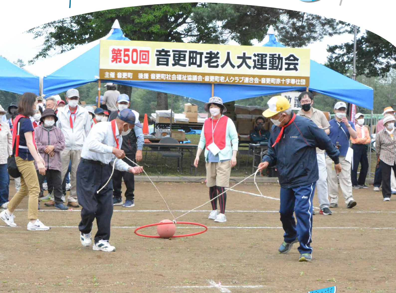
3年ぶりに開催された第50回音更町老人大運動会で競技を楽しむ参加者